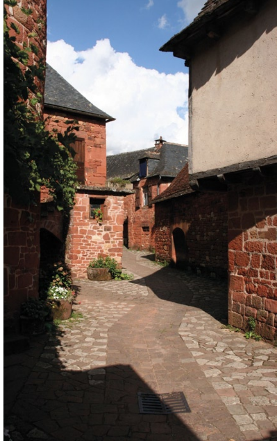
Collonges La Rouge >