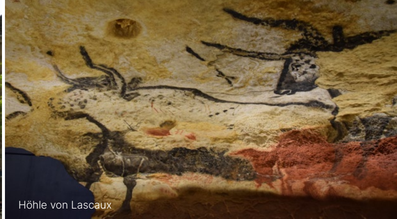
Höhle von Lascaux